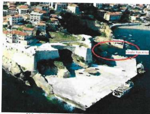
Slika 1. Nekadašnji izgled pristana u Ulcinju

Pokazalo se da je postojeća lučica "Kacema" u Ulcinju skoro potpuno nefunkcionalna pri dejstvu talasa većih visina iz južnog i jugozapadnog pravca. Naime, visine talasa u lučici daleko premašuju dozvoljene visine za takvu vrstu objekata, pa je veoma često dolazi do potapanja manjih plovila koji se nalaze unutar akvatorijuma lučice.