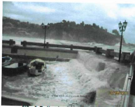
Slika 3. Prelivanje talasa u akvatoriju lučice

Očigledno je da je osnovni uzrok loše efikasnosti lučice Kacema prelivanje talasa preko zaštitinih objekata. Na Slici 3. je prikazano stanje vodene površine u lučici pri intenzivnom prelivanju talasa preko površine zapadnog pristana. Kako je akvatorija lučice veoma mala, poremećaji izazvani prelivanjem talasa se ne mogu amortizovati. Stanje talasanja u lučici je toliko nepovoljno da je neophodno izvaditi sve čamce iz vode (Slika 2), kako bi se sprečilo njihovo potapanje. Pošto su svi zidovi u akvatoriji lučice vertikalni veoma je izražena pojava rezonance, odnosno superponiranja ulaznih visina talasa, što dovodi do haotične slike talasanja u lučici.