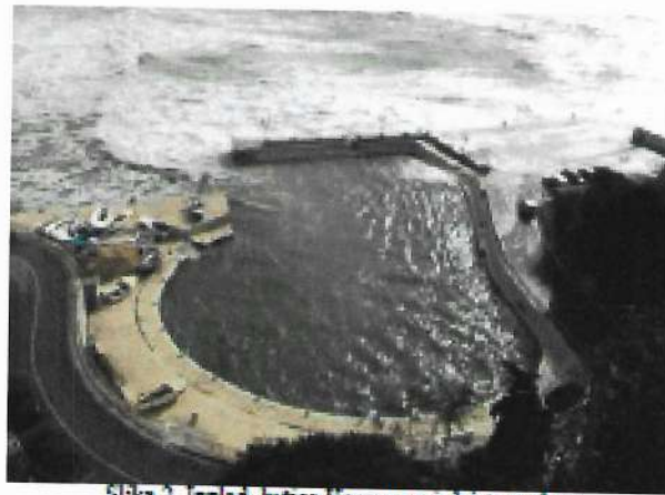
Slika 2. Izgled lučice Kacema pri dejstvu talasa

Očigledno je da je osnovni uzrok loše efikasnosti lučice Kacema prelivanje talasa preko zaštitinih objekata. Na Slici 3. je prikazano stanje vodene površine u lučici pri intenzivnom prelivanju talasa preko površine zapadnog pristana. Kako je akvatorija lučice veoma mala, poremećaji izazvani prelivanjem talasa se ne mogu amortizovati. Stanje talasanja u lučici je toliko nepovoljno da je neophodno izvaditi sve čamce iz vode (Slika 2), kako bi se sprečilo njihovo potapanje. Pošto su svi zidovi u akvatoriji lučice vertikalni veoma je izražena pojava rezonance, odnosno superponiranja ulaznih visina talasa, što dovodi do haotične slike talasanja u lučici.